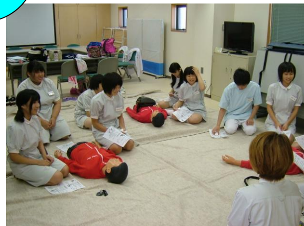
< 担当者の感想 >