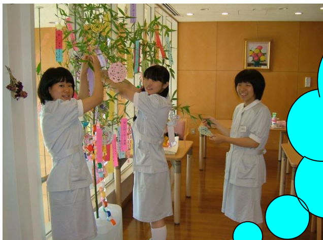
< 参加者の感想 >

・緊張してうまくコミがとれるか心配だったけど、患者さんから話しかけてもらって良かったです。 ・始めて体験したことは ストレッチャーに乗った事。患者さんの気持ちが少しだけわかった気がしました。